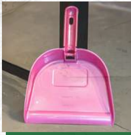
Pazinha de Lixo