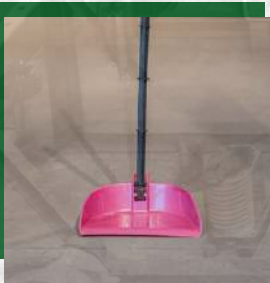
Pazinha de Lixo com cabo

R$ 3,55 até 30 unidades R$ 2,50 acima de 30un