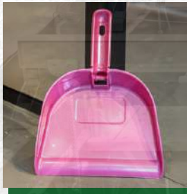
Pazinha de Lixo

R$ 27,50 até 30 unidades R$ 17,20 acima de 30un